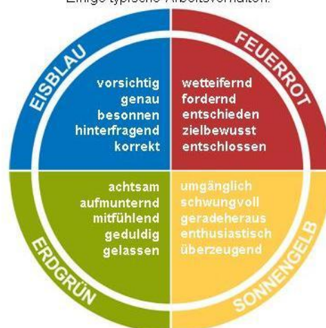
Die 4 Farbenergien von Insights Discovery® Einige typische Arbeitsverhalten:

Mit dem Einsatz von Insights Discovery® bieten wir unseren Trainingsteilnehmern eine Plattform für die Selbstreflektion plus individuelle Lernerfolge zur Steigerung der eigenen Effektivität.